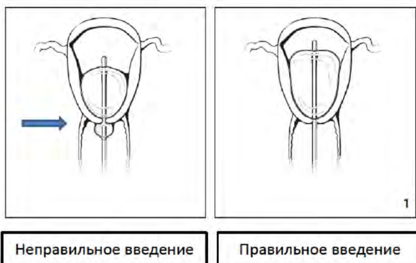
Рис. 1. Размещение внутриматочного баллона